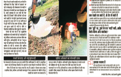
खनिज विभाग की कार्यप्रणाली पर सवाल: सबसे बड़ा सवाल खनिज विभाग की कार्यप्रणाली पर उठता है। खनिज अधिकारी किसी का फोन

अधिकांश मशीनों से खनन करवाते हैं, काले रेत माफियाओं की गड़गड़ाहट से जिले में डर फैल चुका है।