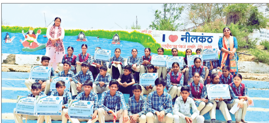
हरिभूमि न्यूज | गैरकट

विश्व पृथ्वी दिवस के अवसर पर सांदीपनि विद्यालय भैरूदा में जल गंगा संवर्धन अभियान के तहत 'नदी को जानो' कार्यक्रम का आयोजन किया गया। यह कार्यक्रम नीलकंठ घाट स्थित नर्मदा नदी तट पर संपन्न हुआ, जहां विद्यार्थियों को जल, नदी और प्राकृतिक संसाधनों के संरक्षण का महत्व समझाया गया। विद्यालय के इको क्लब के तत्वाधान में आयोजित इस कार्यक्रम में विद्यार्थियों ने न केवल स्वयं जानकारी प्राप्त