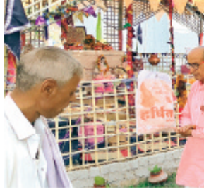
हरिभूमि न्यूज़ ॥ जीरापुर

नगर के मध्य प्राचीन समय से स्थित भगवान देवनारायण का गुर्जर समाज द्वारा मंदिर का निर्माण करवाया गया है। मंदिर निर्माण कार्य पूर्ण होने के बाद अब समाज समिति द्वारा पांच दिवसीय आयोजन किया जा रहा। इस तारतम्य के शुरुआत में नगर में कलश शांभायत्रा निकालने के साथ ही