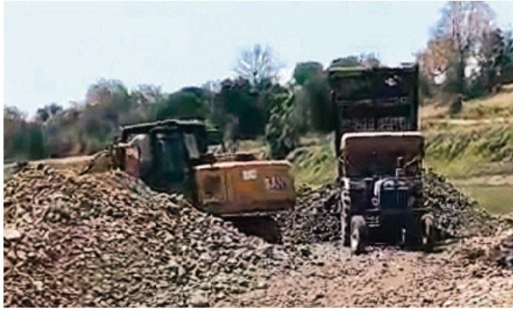
सुरक्षा बलकलेन से काले रेत माफियाओं की गड़गड़ाहट से जिले में डर फैल चुका है।

सेकनपुर में इन माफियाओं की भारी मशीनों और ओवरलॉड ट्रैक्टर ट्रॉली ने ग्रामीण इलाकों की सड़कों का दम निकाल दिया है। करोड़ों की लागत से बनी सड़कें अब सिर्फ धूल और गड़कों का ढेर रह गई हैं। आलम यह है कि सड़क पर डामर ढूँढने से भी नहीं मिलता, लेकिन इन उजड़ी हुई सड़कों पर दौड़ते ट्रैक्टर ट्रॉली अधिकारियों की नजरों से अज्ञात हैं।