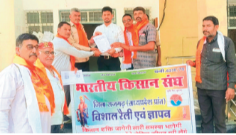
यहाँ रास्ते के जितने भी लंबित प्रकरण हैं उनका समय पर निराकरण कराया गया।

भारतीय किसान संघ ब्लॉक इकाई द्वारा मंगलवार को अपनी विभिन्न मांगों को लेकर प मुख्यमंत्री के नाम एसडीएम रोहित बम्हारे को ज्ञापन सौंपा। जिसमें भारतीय किसान संघ किसानों की समस्याओं को लेकर समय समय पर शासन प्रशासन को अवगत कराते आया है। साथ ही किसानों के स्लाट बुक होने में आ रही परेशानी को दूर कर सभी किसानों के स्लाट बुक करवा कर पंजीयन पर गेहूँ तुलवाए जाए। कृषि पम्प के पुराने तार एवं झूलें हुए तार एवं खम्बे को सही किया जाए। इन्हीं झूलें हुए तारों की वजह से आए दिन आगजनी की दुर्घटना होती रहती है जिससे किसानों को नुकसान होता है। पारली जलाने पर जो भी कार्यवाही शासन द्वारा किसानों पर की गई उस पर रोक लगाई जावे एवं पारली प्रबंधन के लिये शासन द्वारा उचित कार्यवाही की जाए। मण्डियों में गेहूँ समर्थन मूल्य से कम नहीं बिकना चाहिए इसके लिए शासन उचित प्रबंधन करें। सोलर पम्प के लिए किसानों द्वारा राशि जमा की गई उन्हें तुरन्त सोलर पम्प लगाकर दिया जाए। तहसीलदार के