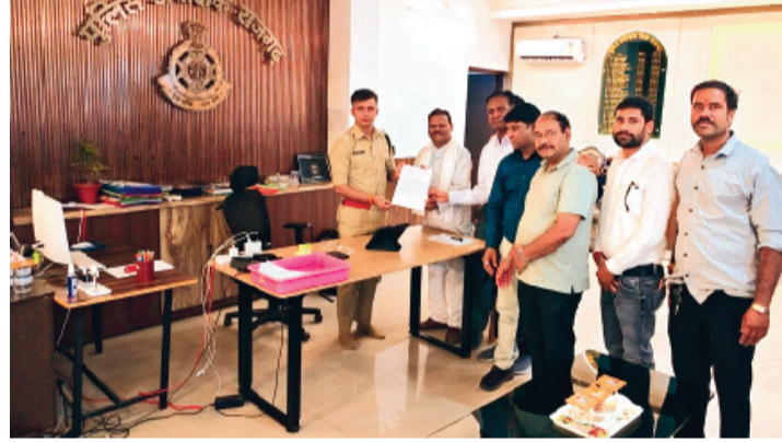
प्रतिनिधि मंडल ने एसपी से की मुलाकात