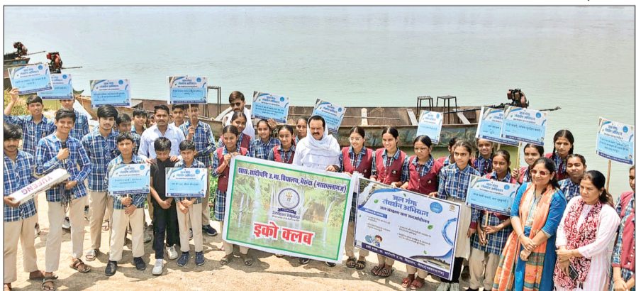
हरिभूमि न्यूज | गैरकट

विश्व पृथ्वी दिवस के अवसर पर सांदीपनि विद्यालय भैरूदा में जल गंगा संवर्धन अभियान के तहत 'नदी को जानो' कार्यक्रम का आयोजन किया गया। यह कार्यक्रम नीलकंठ घाट स्थित नर्मदा नदी तट पर संपन्न हुआ, जहां विद्यार्थियों को जल, नदी और प्राकृतिक संसाधनों के संरक्षण का महत्व समझाया गया। विद्यालय के इको क्लब के तत्वाधान में आयोजित इस कार्यक्रम में विद्यार्थियों ने न केवल स्वयं जानकारी प्राप्त