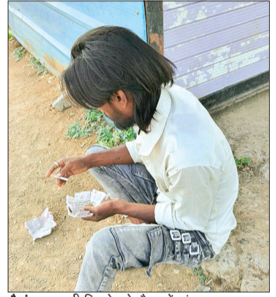
भैरूदा। खाली सिगरेट के रैपर में गांजा भरता युवा

हरिभूमि न्यूज | गैरकट आसपास—युवाओं को खुलेआम गांजा सेवन करते देखा जा सकता है। पहले जहां युवा सिगरेट तक सीमित थे, वहीं अब वे आसानी से गांजे की ओर आकर्षित हो रहे हैं। पान दुकानों और किराना स्टोर्स से खाली सिगरेट और रोलिंग पेपर खरीदकर उसमें गांजा भरकर सेवन किया जा रहा है, जिससे इसकी पहचान करना भी मुश्किल हो गया है। स्थानीय बाजार में "गोगो" नाम से मिलने वाले खाली रैपर और रोलिंग पेपर युवाओं के लिए आसानी से उपलब्ध हैं। एक खाली सिगरेट करीब 10 रुपए में मिल जाती है, जबकि 10 रुपए में तीन रोलिंग पेपर खरीदे जा सकते हैं। सस्ती कीमत और आसान उपलब्धता ने नशे को और बढ़ावा दिया है, जिससे युवा वर्ग तेजी से इसकी ओर खिंचता जा रहा है। पड़ताल में यह भी सामने आया है कि भैरूदा और गोपालपुर थाना क्षेत्र सहित आसपास के इलाकों में गांजा तस्करी का संगठित नेटवर्क सक्रिय है। ग्रामीण क्षेत्रों से शहर में लगातार सप्लाई हो रही है, वहीं कुछ लोग गांवों में जाकर भी गांजा खरीद रहे हैं। कई स्थानों पर यह अवैध