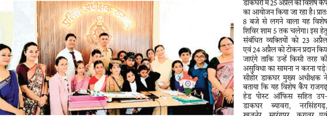
विद्यार्थियों को अपने पास बैठाकर उनसे विभिन्न विषयों पर चर्चा की तथा उनके प्रश्नों का उत्तर दिया।