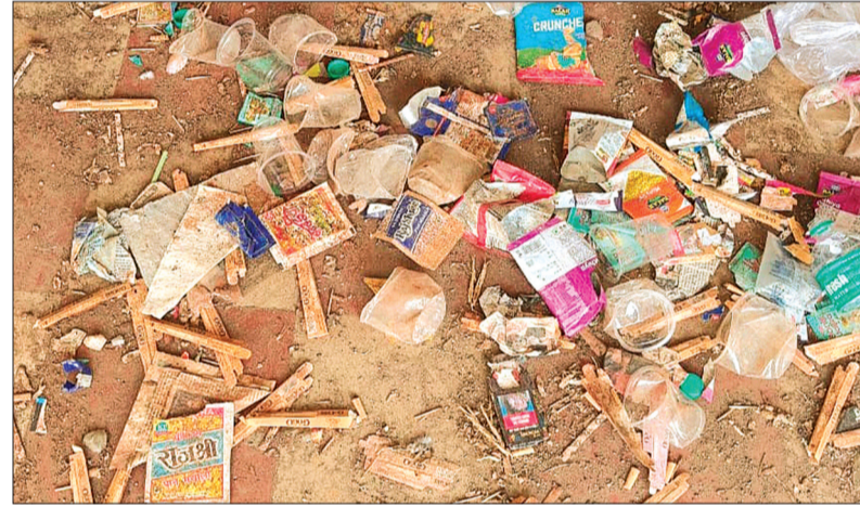
भैरूदा। बड़ी मात्रा में गोगो नाम के रैपर के पैकेट से अंदाजा लगाया जा सकता है।